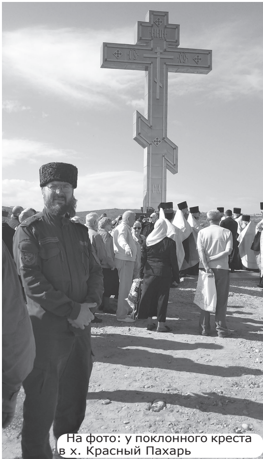
На фото: у поклонного креста в х. Красный Пахарь

дения непокорных горцев были объективной реальностью, пост существовал для того, чтобы отслеживать движение вооруженных групп, проходящих из предгорной части или же степей.